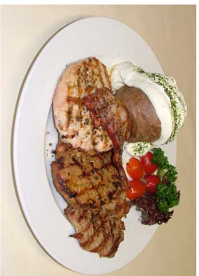
Mittags unsere Nummer 1